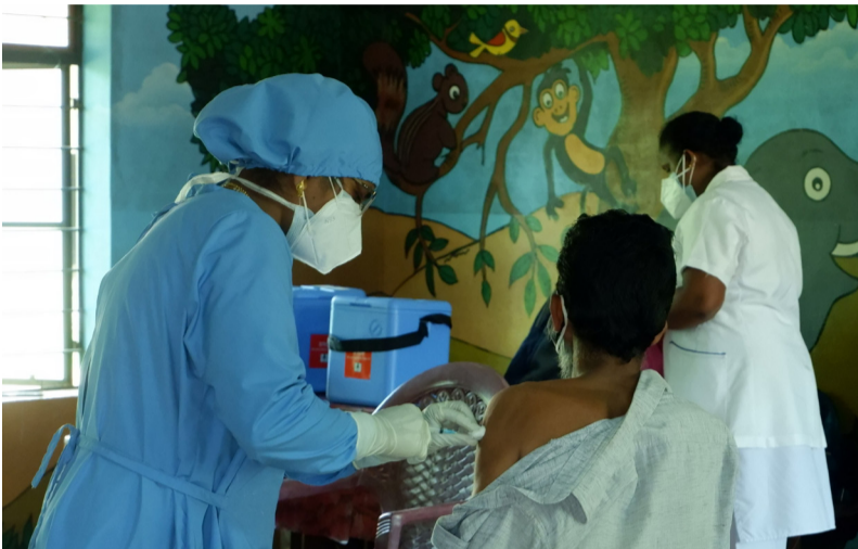
സുരക്ഷയോടെ കൈകോർത്ത്... അങ്ങാടിക്കടവ് യു .പി സ്കൂൾ വാക്സിനേഷൻ കേന്ദ്രത്തിൽ നിന്നുള്ള ദൃശ്യം.