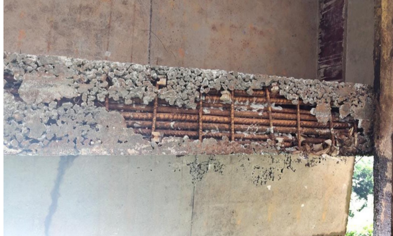
പാലത്തിന്റെ പ്രധാന ബീമിൽ തെളിഞ്ഞ് കാണുന്ന ഇരുമ്പ് കമ്പികൾ