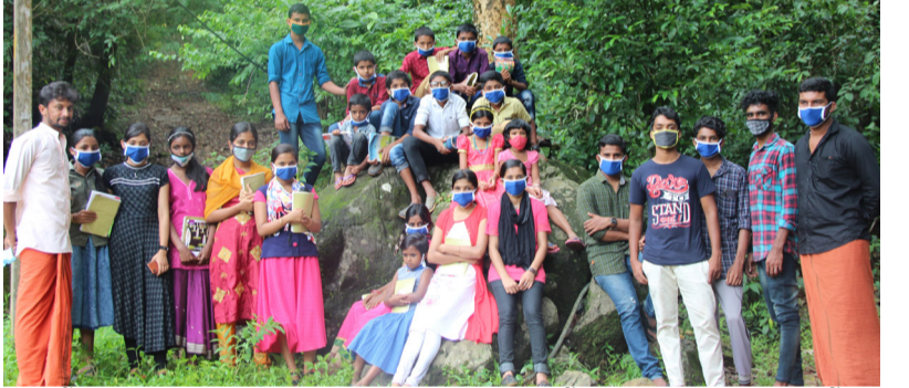
റേഞ്ച് തേടി: ഓൺലൈൻ പഠനത്തിനായി റേഞ്ച് തേടുന്ന രണ്ടാം കടവ് തുടിമരത്തെ കുട്ടികൾ