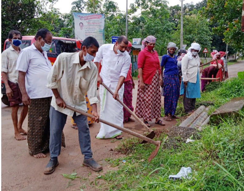
പ്രതിരോധ പ്രവർത്തനത്തിന്റെ ഭാഗമായി കച്ചേരിക്കടവ് ടൗൺ തൊഴിലുറപ്പുകാരുടെ സഹകരണത്തോടെ വൃത്തിയാക്കുന്നു

ഡെങ്കിപ്പനി പഞ്ചായത്തിൽ റിപ്പോർട്ട് ചെയ്തതിനെ തുടർന്ന് വാർഡ് തലത്തിൽ ശുചീകരണ പ്രവർത്തനങ്ങൾ ആരംഭിച്ചു. പഞ്ചായത്തിലെ പ്രധാന ടൗണുകളായ അങ്ങാടിക്കടവ്, ആനപ്പന്തി, കച്ചേരിക്കടവ് തുടങ്ങിയ സ്ഥലങ്ങളിലാണ് പഞ്ചായത്തിന്റെ നേതൃത്വത്തിൽ തൊഴിലുറപ്പുകാരുടെ സഹകരണത്തോടെ ശുചീകരണത്തിന് തുടക്കം കുറിച്ചത്. അയ്യൻകുന്നിനോട് ചേർന്നുകിടക്കുന്ന ആരംഗ്രാമപഞ്ചായത്തിൽ ഡെങ്കിപ്പനി കൂടുതലായി റിപ്പോർട്ട് ചെയ്യുന്നുണ്ട്. ഡെങ്കിപ്പനി പകരാതിരിക്കാനായി കർശന മാർഗനിർദ്ദേശങ്ങളാണ് പഞ്ചായത്തും അങ്ങാടിക്കടവ് പ്രാഥമിക ആരോഗ്യ കേന്ദ്രവും നൽകിയിരിക്കുന്നത്.